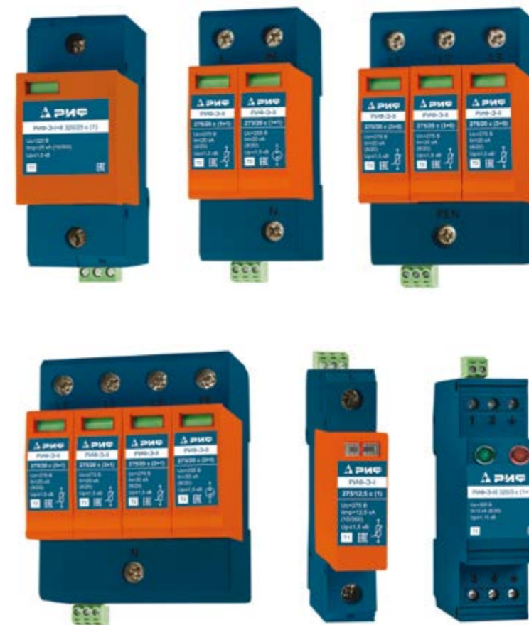
Параллельная установка РИФ-Э-III 320/3 с (1+1) в электрическую сеть.